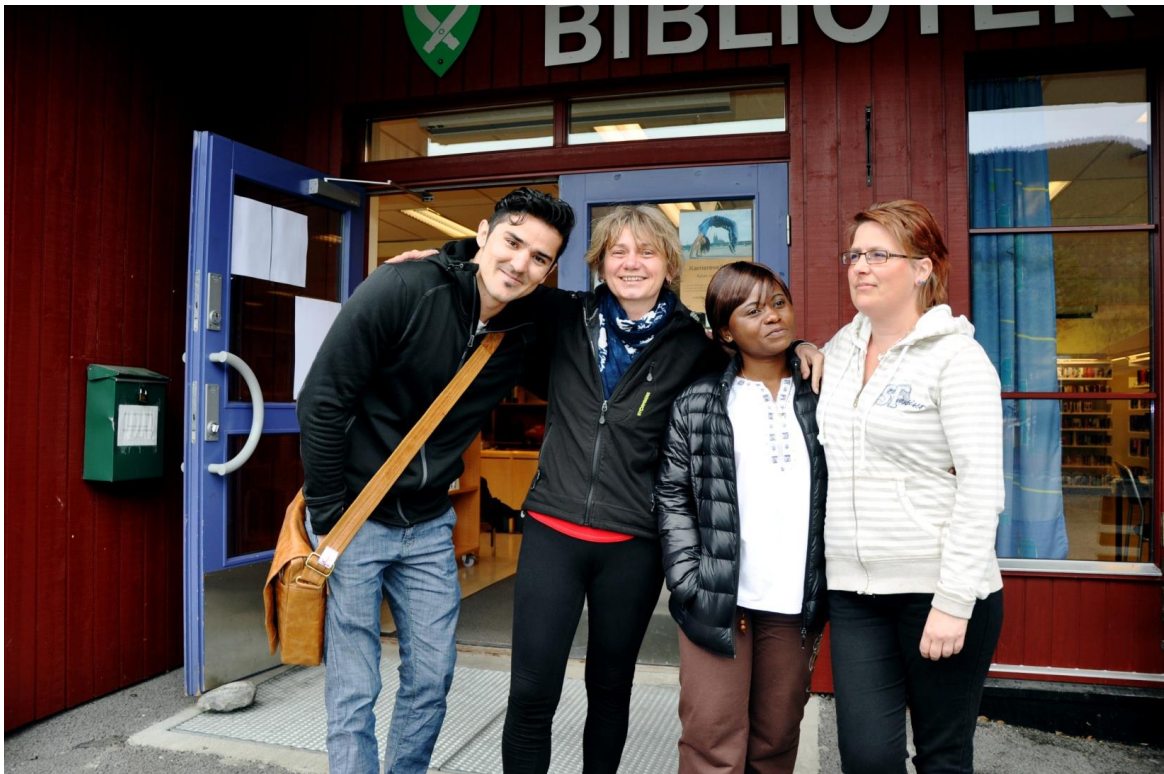
Fra prosjektet «Storytelling», i samarbeid med historielaget og voksenopplæringen.

Biblioteket er en viktig integreringsarena. Frivillige gir tilbud på biblioteket om norsktrening og leksehjelp, biblioteket tilbyr kopiering, publikumspc'er, skriver og bøker på morsmål fra Flerspråklig bibliotek.