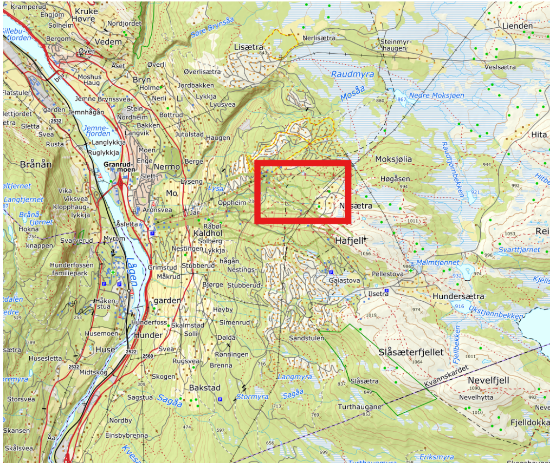
Figur 1: planomriss innenfor Øyer-området.

kravde per brev mottatt 20.10.2025 at planinitiativet skulle forelegges for kommunestyret for politisk behandling. Kommunestyret vedtok 20.11.2025 å ta imot planinitiativet til videre behandling. Varsel om oppstart med forslag til planprogram ble sendt ut 08.12.2025 med høringsfrist 16.02.2026.