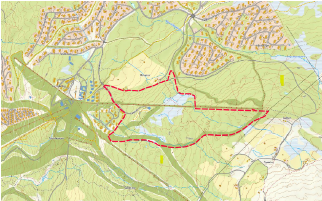
Figur 2: Planområdet vist med rød stiptet linje. Hentet fra planprogram, datert 18.03.2026.